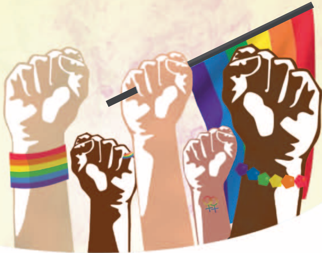
Pride®, Gay Pride®, Lesbian&GayPride® : marques déposées, tous droits réservés SORFIDED. - Graphisme : Fanny Koch

1995-2015 : FIER.E.S DE NOS LUTTES, CONTINUONS DE MARCHER